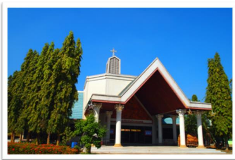
วัดแม่พระเป็นที่พึ่งท่าหว้า