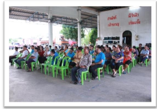
๖. โครงการรณรงค์ป้องกันโรคเอดส์ งบประมาณ ๔,๐๖๐.-บาท