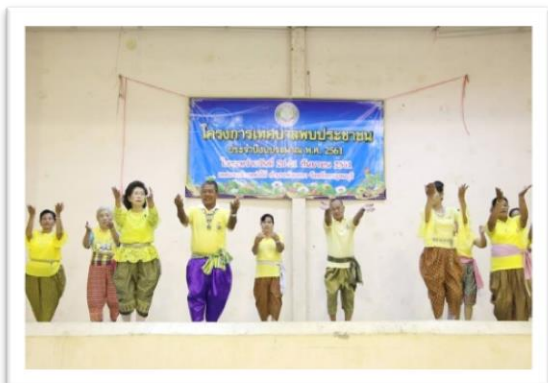
๑. โครงการเทศบาลพบประชาชน งบประมาณ ๗,๗๗๕.-บาท