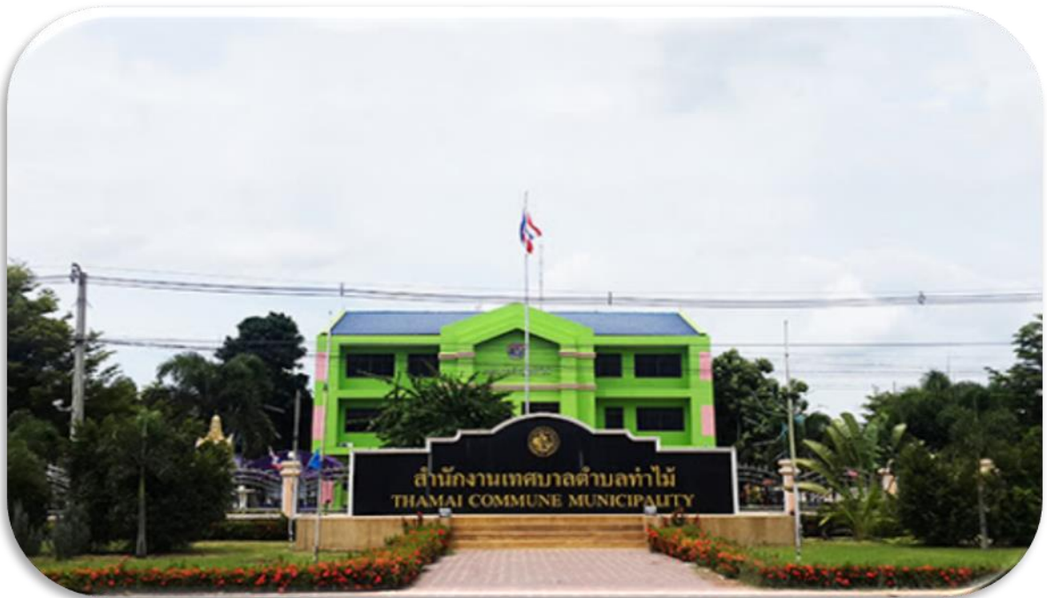
สำนักงานเทศบาลตำบลท่าไม้

เทศบาลตำบลท่าไม้ เดิมที่มีฐานะเป็นสุขาภิบาล มีชื่อเรียกว่า “สุขาภิบาลท่าไม้” ได้จัดตั้งขึ้นวันที่ ๗ พฤศจิกายน ๒๕๓๓ ตามประกาศราชกิจจานุเบกษา เล่มที่ ๑๐๗ ตอนที่ ๒๒๒ หน้า ๙๓๐๐ ต่อมาได้รับการเปลี่ยนแปลงฐานะจากสุขาภิบาลท่าไม้ เป็น “เทศบาลตำบลท่าไม้” ตามพระราชบัญญัติการเปลี่ยนแปลงฐานะจากสุขาภิบาลเป็นเทศบาลในปี พ.ศ. ๒๕๔๒ ดังปรากฏตามประกาศราชกิจจานุเบกษา เล่ม ๑๑๖ ตอนที่ ๙ก. วันที่ ๒๔ กุมภาพันธ์ ๒๕๔๒ ซึ่งมีผลบังคับใช้วันที่ ๒๕ พฤษภาคม ๒๕๔๒ และเวลาต่อมาได้มีประกาศจากกระทรวงมหาดไทย เรื่อง การรวมและการยุบรวมองค์กรปกครองส่วนท้องถิ่น โดยให้องค์การบริหารส่วนตำบลท่าไม้ รวมกับเทศบาลตำบลท่าไม้ เป็นไปตามประกาศของกระทรวงมหาดไทย ลงวันที่ ๙ กรกฎาคม ๒๕๔๗ ปัจจุบันสถานที่ทำการของสำนักงานเทศบาลตำบลท่าไม้ ตั้งอยู่เลขที่ ๙๙ หมู่ที่ ๙ ตำบลท่าไม้ อำเภอท่ามะกา จังหวัดกาญจนบุรี มีพื้นที่เขตการปกครองทั้งหมดประมาณ ๑๗.๗๑๒ ตารางกิโลเมตร อยู่ห่างจากที่ว่าการอำเภอท่ามะกา ระยะทางประมาณ ๕ กิโลเมตร อยู่ห่างจากจังหวัดกาญจนบุรี ระยะทางประมาณ ๓๓ กิโลเมตร และห่างจากกรุงเทพมหานคร ระยะทางประมาณ ๙๒ กิโลเมตร