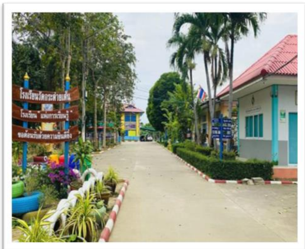
โรงเรียนวัดกระต่ายเต้น

๒.๒ โรงเรียนวัดศรีอพนัน (ถมยาประชาอุทิศ)