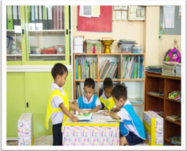
ศูนย์พัฒนาเด็กเล็กบ้านกระต่ายเต้น