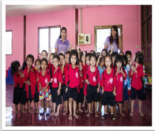
ศูนย์พัฒนาเด็กเล็กวัดศรีอพนัน