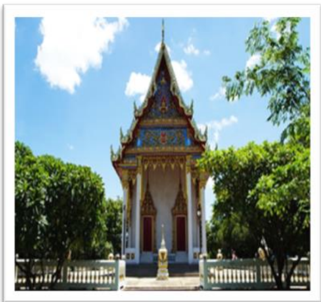
วัดศรีอพนัน

การนับถือศาสนาประชาชนภายในเขตเทศบาลตำบลท่าไม้ ประชาชนโดยส่วนใหญ่ นับถือศาสนาพุทธ ซึ่งจะมีบางส่วนที่นับถือศาสนาคริสต์ ศาสนสถานที่สำคัญวัดพุทธ จำนวน ๒ แห่ง ได้แก่ วัดศรีอพนัน ตั้งอยู่ในพื้นที่หมู่ที่ ๗ ตำบลท่าไม้ และวัดกระต่ายเต็น ตั้งอยู่ในพื้นที่ หมู่ที่ ๒ ตำบลท่าไม้ และมีโบสถ์คริสต์ จำนวน ๑ แห่ง คือ วัดแม่พระเป็นที่พึ่งทำหว่าตั้งอยู่ที่หมู่ที่ ๙ ตำบลท่าไม้