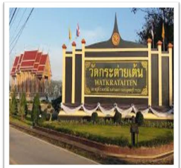
วัดกระต่ายเต็น