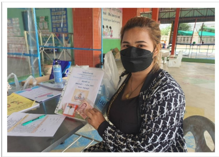
๑. โครงการสนับสนุนการบริการสถานศึกษา ‘งบประมาณดำเนินการ ๑๑๒,๒๐๐.-บาท