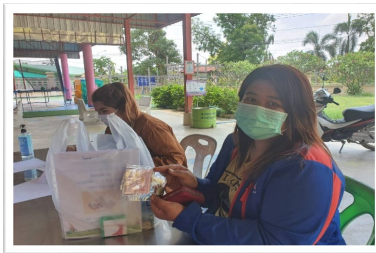
๒. โครงการอาหารกลางวันเด็กนักเรียน งบประมาณดำเนินการ ๖๓๙,๕๕๕.-บาท