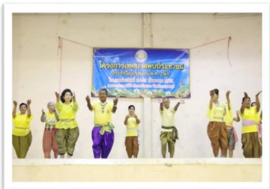
๑. โครงการเทศบาลพบประชาชน งบประมาณ ๗,๗๗๕.-บาท