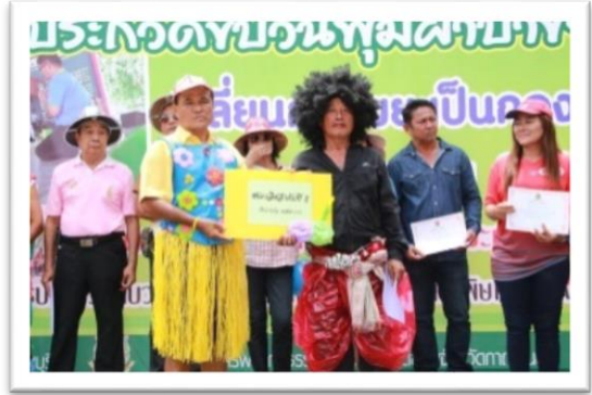
๒.โครงการอนุรักษ์ส่งเสริม ฟื้นฟู ทรัพยากรธรรมชาติและสิ่งแวดล้อม งบประมาณ ๙๙,๔๖๐.-บาท