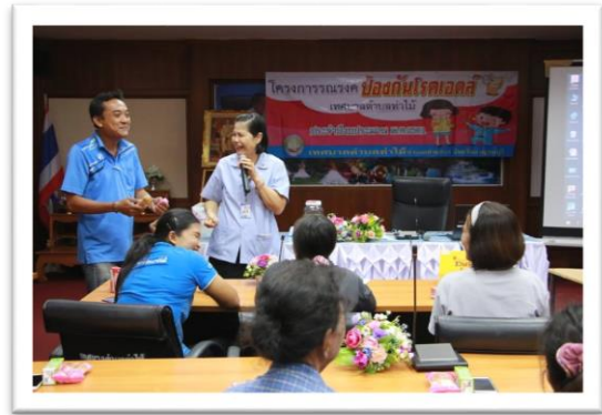
๗. โครงการคุ้มครองผู้บริโภค งบประมาณ ๘,๖๖๐.- บาท