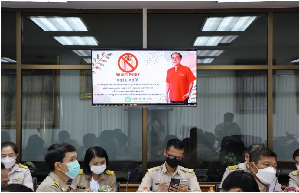
จัดประชุม สัมนาเผยแพร่ประชาสัมพันธ์ ในหน่วยงานให้เจ้าหน้าที่ทุกระดับทราบ